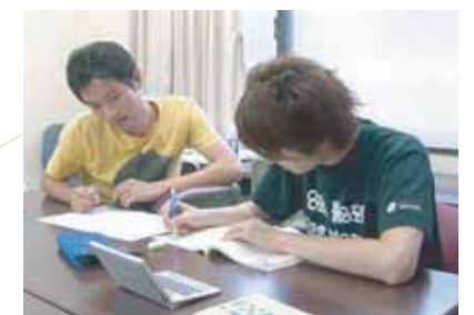
やる気が出た時に、いつでもどこでも個別対応