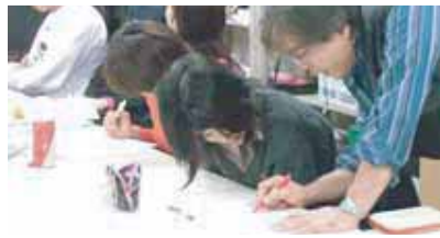
納得のゆくまで学習ができる個別対応