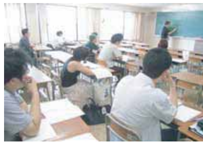
コスモ生の理解度を確認しながら行われる講義