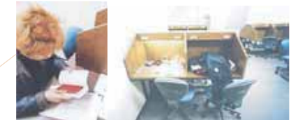
自習のはかどる個別ブース型の机