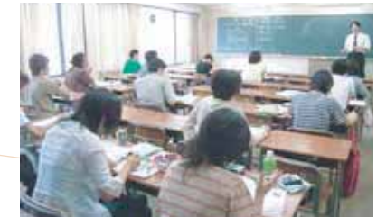
出席するだけで高卒認定を突破