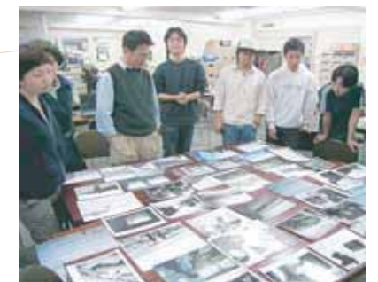
どこでもゼミを開くフットワークの良さ