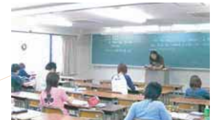
緊張感のある大学受験の講義