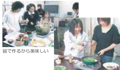
皆で作るから美味しい