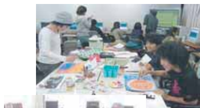
講師をつかまえていつでも学習