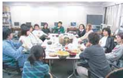
自由な発言が楽しい、リラックスした雰囲気でのゼミ